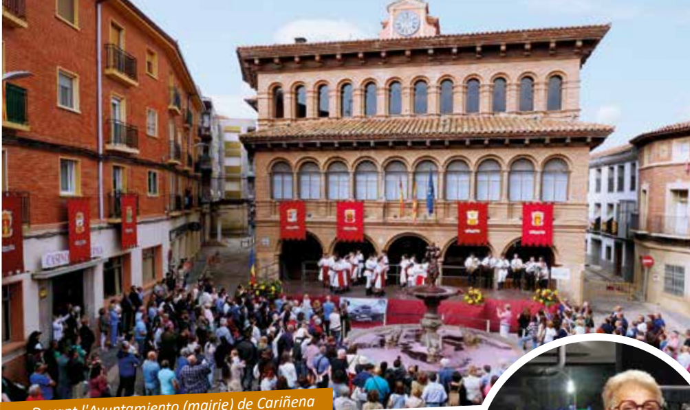
Devant l'Ayuntamiento (mairie) de Cariñena