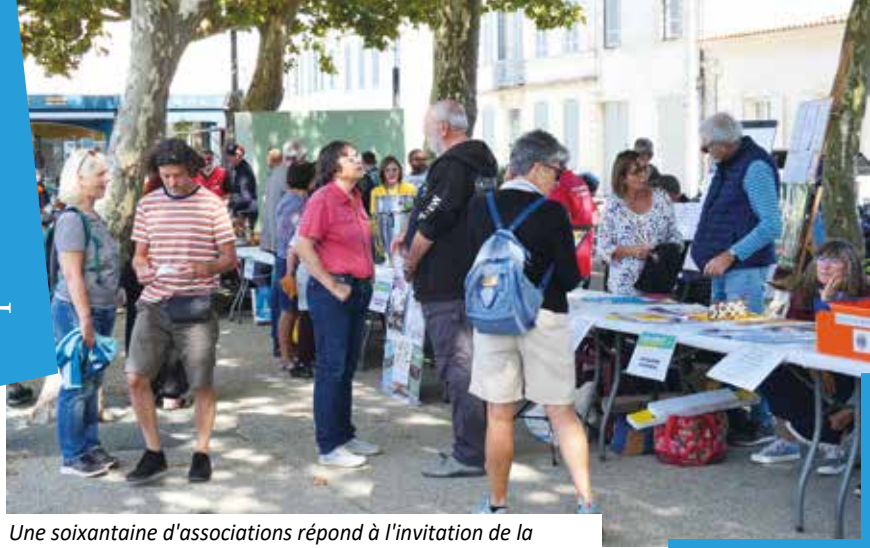
Une soixantaine d'associations répond à l'invitation de la municipalité. Sur le parvis de la place, les bénévoles se côtoient