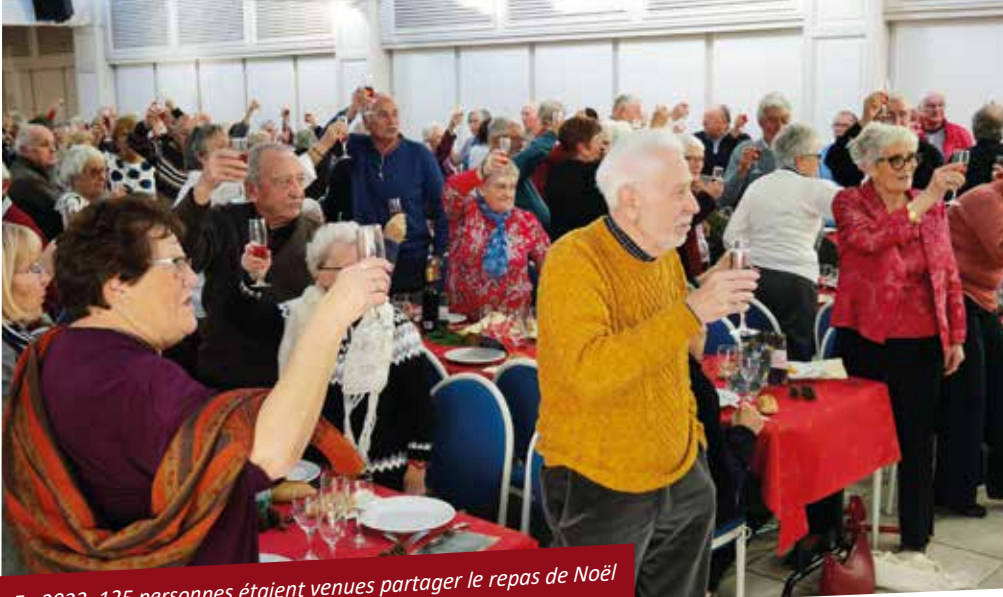
En 2023, 125 personnes étaient venues partager le repas de Noël