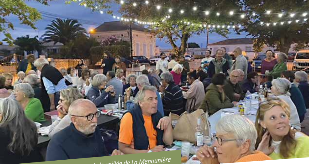
Le public a répondu à l'invitation de la veillée de La Menouinière