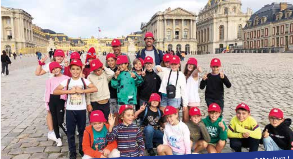
Des élèves de l'école de La Cotinière ont passé trois jours à la capitale : au programme, sport et culture !