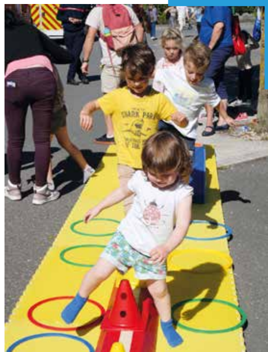
Les ateliers de démonstration répondent à la curiosité, même des tout-petits qui se prêtent au jeu d'un exercice de gymnastique