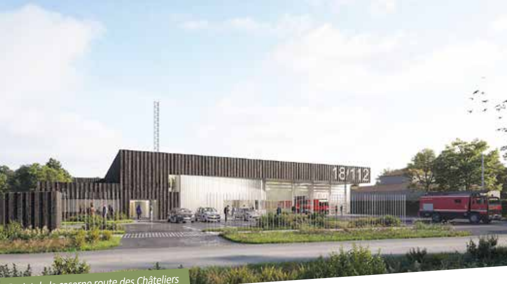
Projet de la caserne route des Châteliers