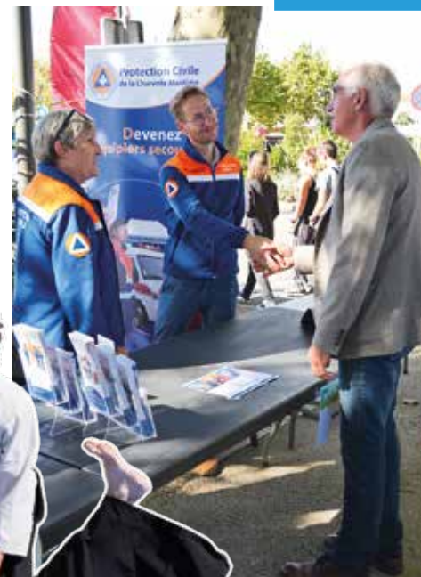
La protection civile toujours présente lors des grands événements