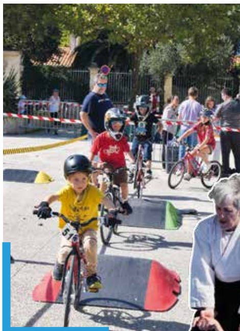
Circuit ludique du PCO

Monsieur le maire, entouré du directeur général des services de la ville et du président de l'office municipal des sports a remis quelques médailles de Saint-Pierre Olympique. Les bénéficiaires, représentants d'associations, directeurs d'école ou encore agents municipaux et élus, ont reçu cette distinction pour leur engagement à l'aventure Terre de Jeux.