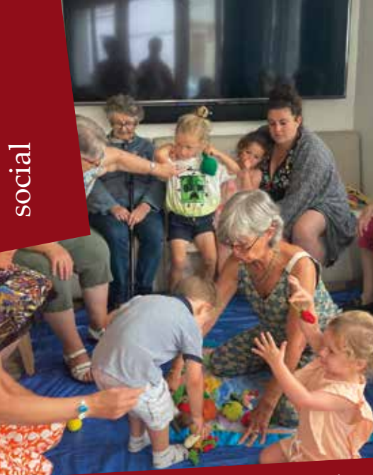
Résidence Oh Activ, les enfants s'amuse