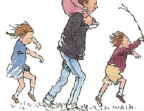
Illustration pochée de l'école des loisirs