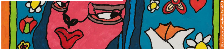
La Joconde de Ves-Jules Fleuri