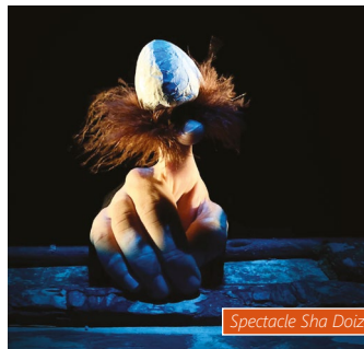
Spectacle Sha Doizo

Sha Doizo est un spectacle poétique de marionnettes qui sera présenté aux enfants de maternelle et primaire. En musique, ce personnage imaginaire fera voyager les tout-petits, jeudi 30 janvier.