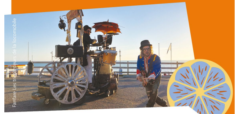
Fanfare Les trimardeurs de la locomobile

En déambulation avec leur rosalie customisée le trio propose des reprises de chansons françaises retravaillées pour le plus grand plaisir des petits et des grands.